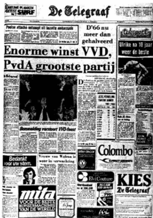
Recordwinst VVD, De Telegraaf, 1982.

op basis van de verschillende leeftijdsgroepen dan zien we dat het CDA steeds meer verloor onder de kiezers van jonger dan vijftig jaar. De score onder de jongste leeftijdsgroep was zelfs minder dan 20% geworden. Bij de PvdA was er weinig verschil tussen de verschillende leeftijdsgroepen. Het slechtste resultaat werd behaald onder de kiezers tussen de achttien en vijfentwintig jaar. Spectaculair was het resultaat van de VVD. Over de hele linie steeg de VVD in aanhang. Bij personen onder de vijfentwintig jaar echter het meest. Met een uitslag van 30% onder die groep werd de VVD in die groep de grootste partij. Op basis van de uitslag van deze verkiezingen werd door CDA en VVD het Kabinet-Lubbers gevormd.