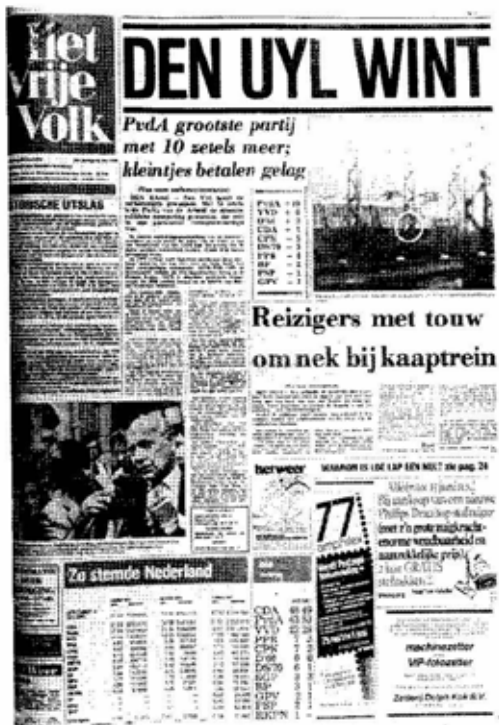
Het Vrije Volk viert de grote overwinning, 1977.

De uitslag was opmerkelijk. Het CDA slaagde erin de dalende trend van de voorgaande drie verkiezingen te stoppen en de PvdA en de VVD boekten beide een zeer forse winst. Van de overige partijen behaalde alleen D'66 een goed resultaat. Alle andere nieuwe partijen leden forse verliezen. Het was duidelijk dat de strijd om de vraag wie de grootste zou worden, PvdA of CDA, een deel van het electoraat van de kleine partijen had weggezogen. Sinds 1959 had bijvoorbeeld de PSP nog nooit zo'n slecht resultaat behaald.