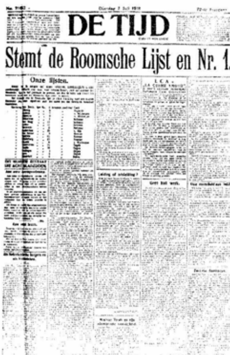
De Tijd roept op in 1918.

De Sociaal Democratische Arbeiderspartij (SDAP) behaalde met 22,0% de tweede plaats. Ook dat is een duidelijke stijging ten opzichte van de uitslag van 1913, die ongetwijfeld samenhangt met het loslaten van het criterium 'welstand'. De liberale partijen van verschillende schakering, die vanaf 1922 de Liberale Staatspartij 'De Vrijheidsbond' vormden behaalden 15,1% van de stemmen. Dat was een zeer forse achteruitgang ten opzichte van de verkiezingen van 1913. Met name de Liberale Unie dook, onder invloed van het Algemeen Kiesrecht, fors naar beneden. De Anti-Revolutionaire Partij (ARP) behaalde met 13,4% een lichte winst ten opzichte van het resultaat van 1913, en de 6,6% van de Christelijk-Historische Unie (CHU) betekende een licht verlies ten opzichte van 1913. De Socialistische Democratische Partij, de voorloper van de Communistische Partij van Nederland (CPN) behaalde 2,3%. Onder de gekozen Kamerleden komen we de namen tegen van: Colijn (ARP), De Savornin Lohman (CHU), Troelstra (SDAP), Treub (Economische Bond), Wijkoop (SDP) en als enige vrouw Suzie Groeneweg (SDAP). Opmerkelijk is het, gezien vanuit het huidige perspectief, dat zoals het dagblad De Tijd meldde 'de verhouding links-rechts fifty-fifty was' waarbij alle partijen behalve de RKSP, ARP en CHU tot links gerekend werden. Op basis van deze verkiezingsuitslag werd de regering Ruijs de Beerenbrouck op 9 september 1918 gevormd. Deze regering ontstond met steun van de volgende partijen: RKSP, CHU en ARP.